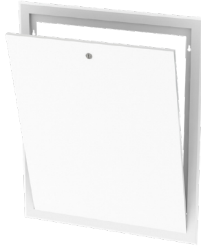
Lisätarvike: Kehys luukulla