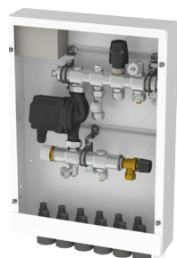
TMix XS i skåp med elpatron och omkopplingspaket för sommar- och vinterdrift