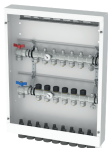
Fördelare monterad i skåp