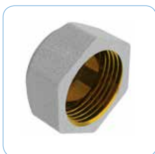
HUV R 20 Artikelnr: 76601