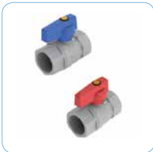
KULVENTIL, RAK Artikelnr: 75901 (Blå) 75902 (Röd)