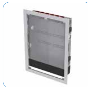
MULTI FÖRDELARSKÅP Komplett Artikelnr: 75701 390 mm 75702 540 mm 75703 690 mm