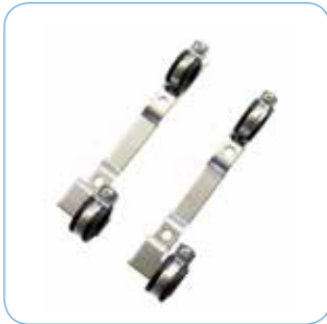
KONSOL Artikelnr: 75000