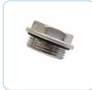
PROPP R 20 Artikelnr: 76602