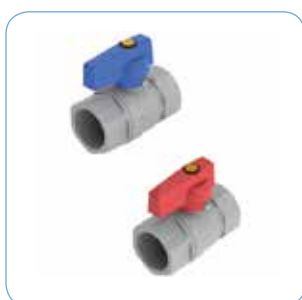
KULVENTIL, RAK Artikelnr: 75901 (Blå) 75902 (Röd)