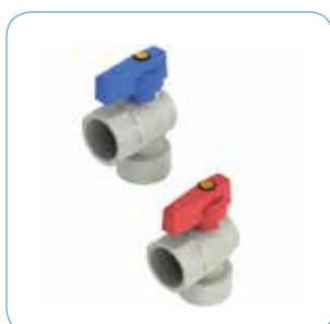
KULVENTIL, VINKLAD Artikelnr: 75903 (Blå) 75904 (Röd)

Används när fördelaren ansluts mot radiatorer.