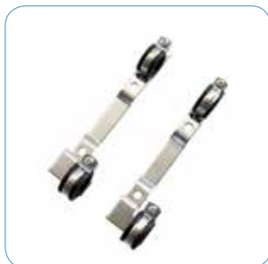
KONSOL Artikelnr: 75000