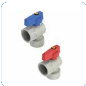
KULVENTIL, VINKLAD Artikelnr: 75903 (Blå) 75904 (Röd)