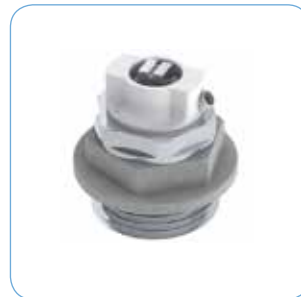
PROPP MED AVLUFTNINGSVENTIL R 20 - R 15 Artikelnr: 76603 Används när fördelaren ansluts mot radiatorer.