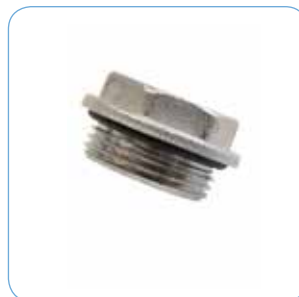
PROPP R 20 Artikelnr: 76602